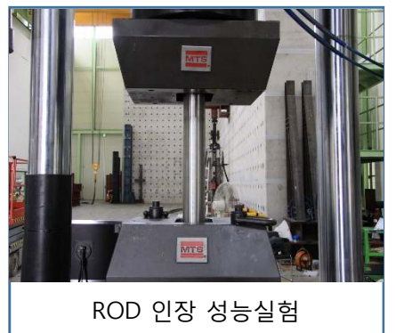
ROD 인장 성능시험