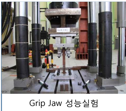
Grip Jaw 성능시험