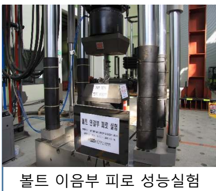
볼트 이음부 피로 성능시험