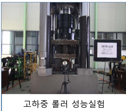
고하중 롤러 성능시험