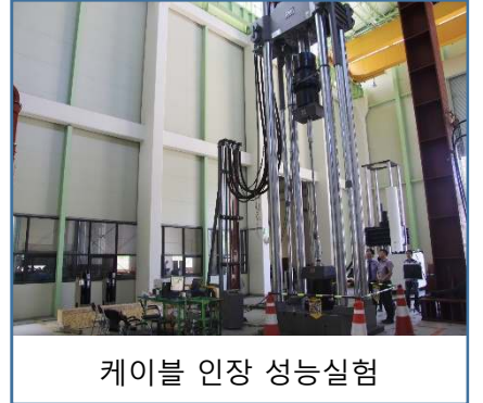
케이블 인장 성능시험