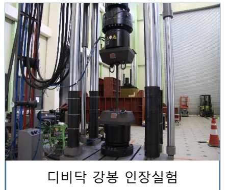
디비닥 강봉 인장시험