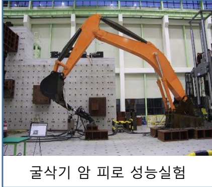
굴삭기 암 피로 성능시험