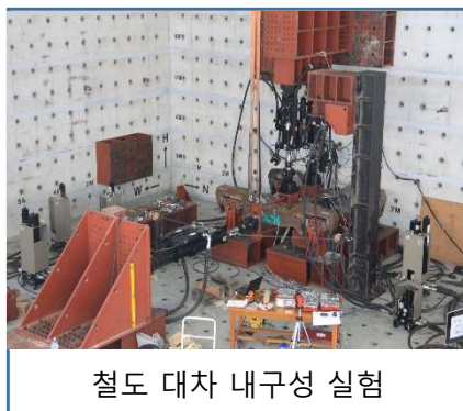
철도 대차 내구성 시험