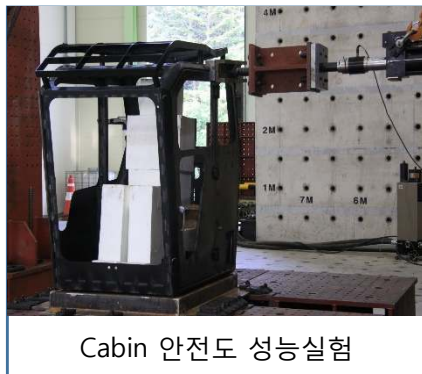
Cabin 안전도 성능시험